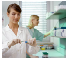
Kliniken- / Universitätskliniken