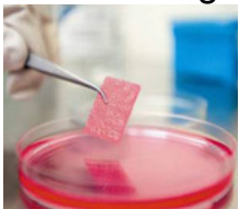
Bio Tissue Engineering