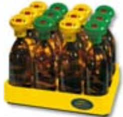
OxiTop® IS 12