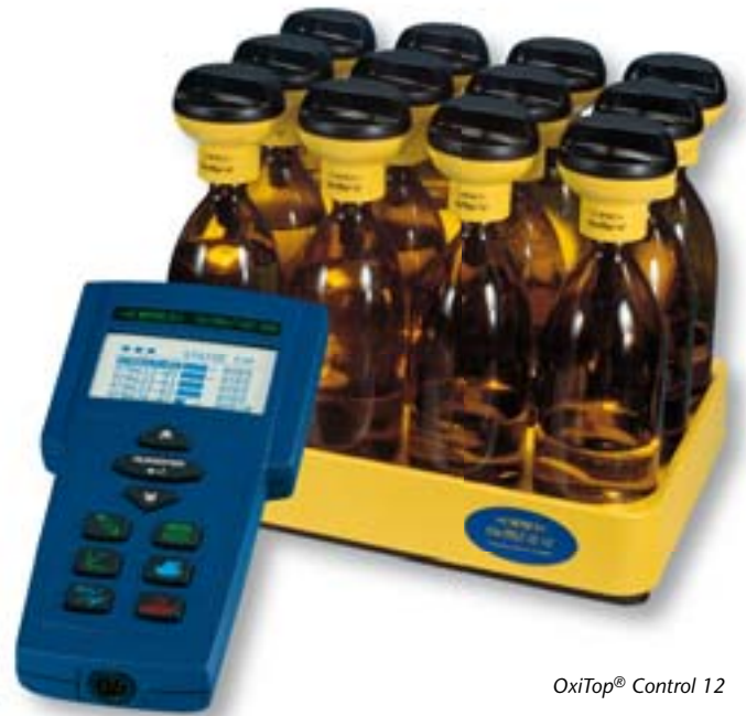
OxiTop® Control 12

Für Anwender, die neben dem BSB auch andere Anwendungen haben, ist OxiTop® Control S6 / S12 mit dem Controller OC 110 die richtige Wahl (s. Seite 74).