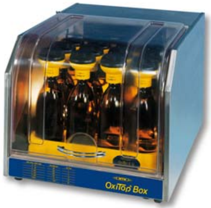
Anwendungsbeispiel: OxiTop® Box mit OxiTop® Control 12

Die Box hat eine automatische Abtaufunktion mit Tauwasserverdunstung.