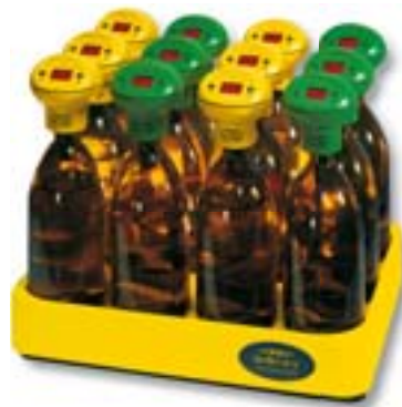
OxiTop® IS 12