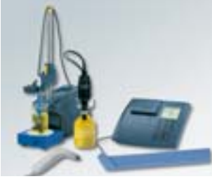
inoLab® BSB/BOD 740 mit StirrOx® G