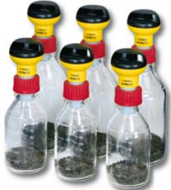
Anwendungsbeispiel mit Messgefäßen Typ PF/45..

Zur Messung der Bodenatmung entsprechend der AT 4 -Richtlinie gibt es ein speziell abgestimmtes Paket, das Messgefäße mit 2,5 l Fassungsvermögen sowie einen speziellen CO 2 -Absorber mit Indikator enthält.