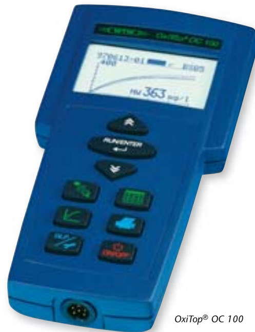
OxiTop® OC 100