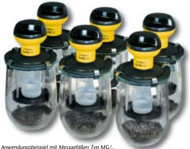
Anwendungsbeispiel mit Messgefäßen Typ MG/..