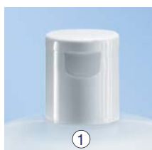
① Klappscharnierschluss, PP, weiß