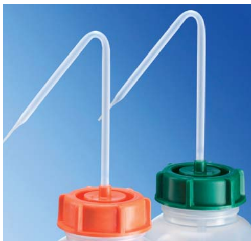
Spritzrohr naturfarben mit farbiger Kappe

* Verpackungseinheit/Mindestabnahmemenge ** UVP = Stück unterverpackt