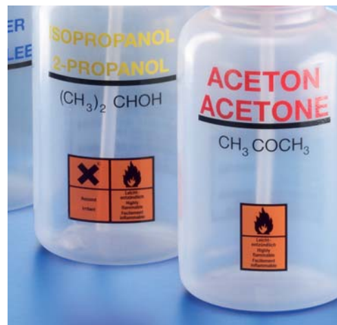
Aufdruck Inhaltstoffe und Gefahrgut