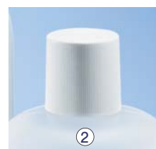
② Verschluss mit Lippendichtung, PP, weiß